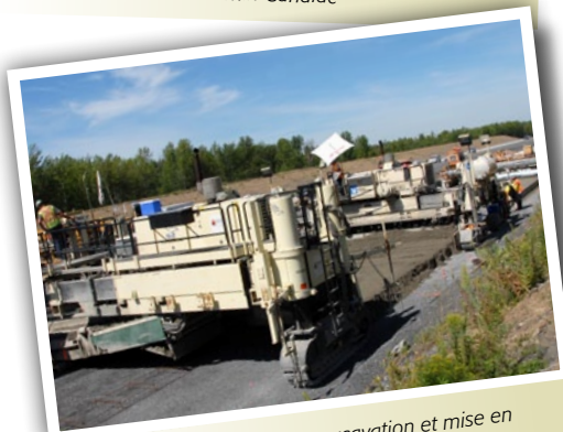
Construction des chaussées, excavation et mise en place de pierres, à l'est du pont ferroviaire