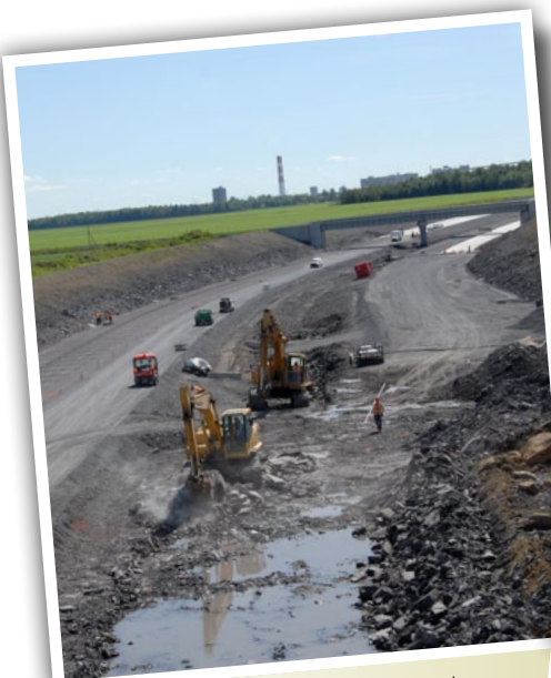
Pont d'étagement ferroviaire du CP passant au-dessus de l'autoroute 30