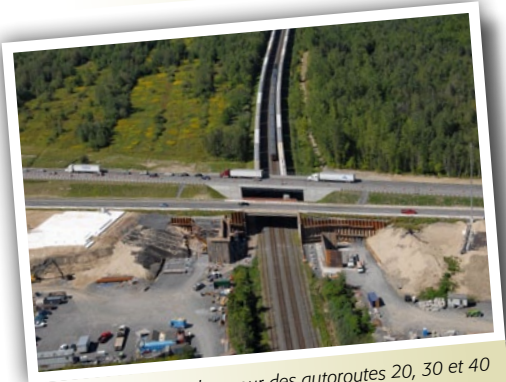
Construction de l'échangeur des autoroutes 20, 30 et 40