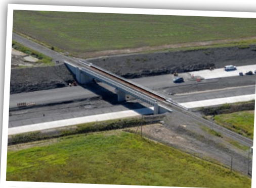
Construction des ponts d'étagement de l'autoroute 30 passant au-dessus du chemin Candiac

Au cours des prochaines semaines, la construction de ces deux ponts d'étagement, de la station de pompage et de la chaussée en béton, de même que les travaux de terrassement seront terminés. Finalement, les travailleurs procéderont au raccordement de ce nouveau tronçon avec les voies de l'autoroute 30 actuelle.