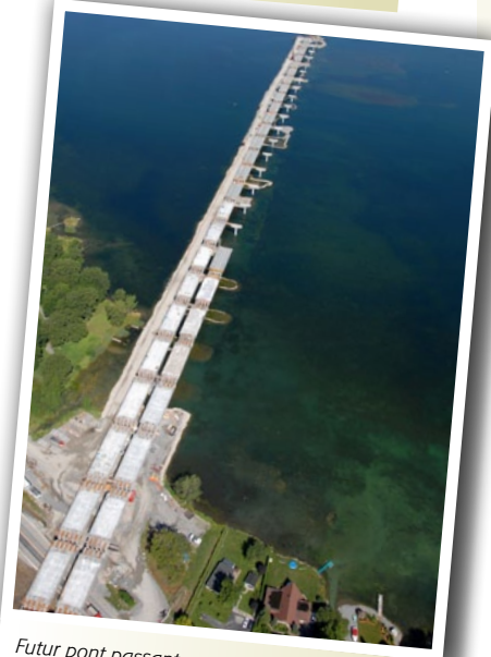
Futur pont passant au-dessus du fleuve Saint-Laurent