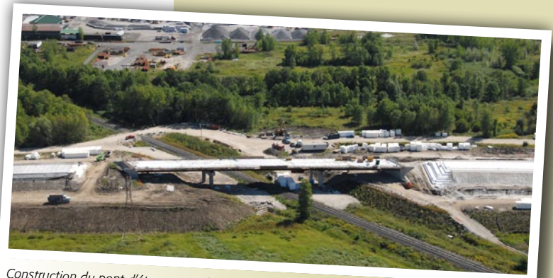
Construction du pont d'étagement de la route 236 passant au-dessus de la voie ferrée de CSX

Le chantier de la relocalisation de la route 236 à Beauharnois tire aussi à sa fin. La construction du pont de la route 236 passant au-dessus de la voie ferrée de CSX, de même que les travaux de terrassement tels que l'asphaltage, la mise en place de la terre végétale et l'ensemencement, se poursuivront afin d'assurer la fin des travaux dès cet automne. Bien que les travaux seront complétés en novembre par le Ministère, la nouvelle route 236 sera ouverte à la circulation en décembre 2012, soit en même temps que la partie Ouest de l'autoroute 30 construite en PPP, une partie des travaux nécessaires à la relocalisation de la route 236 devant être réalisés par le partenaire privé dans le cadre du parachèvement de l'autoroute 30.