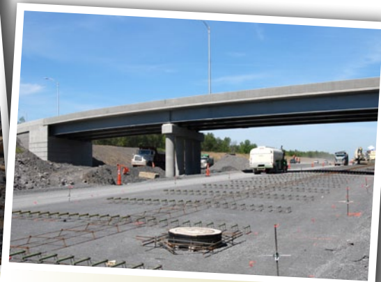
Construction de la dalle de béton du tronçon Jean-Leman