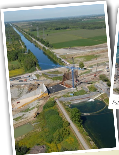
Construction du tunnel passant sous le canal de Soulanges

Il est possible de suivre l'avancement des travaux de la partie Ouest réalisés en PPP en consultant le site Internet de NA-30 au www.na30.ca .