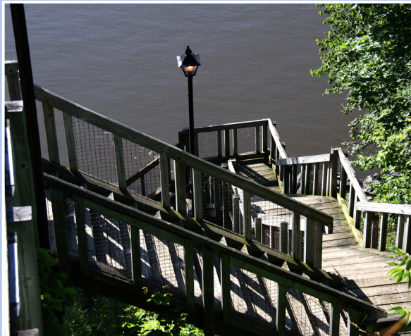
Belvédère du cap Lauzon, Deschambault-Grondines

Utiliser des matériaux de construction reconnus pour leur robustesse, leur facilité d'entretien et difficiles à vandaliser. De plus, il est recommandé de privilégier des matériaux nobles et de provenance locale dont on connaît le comportement, surtout par rapport au climat québécois.