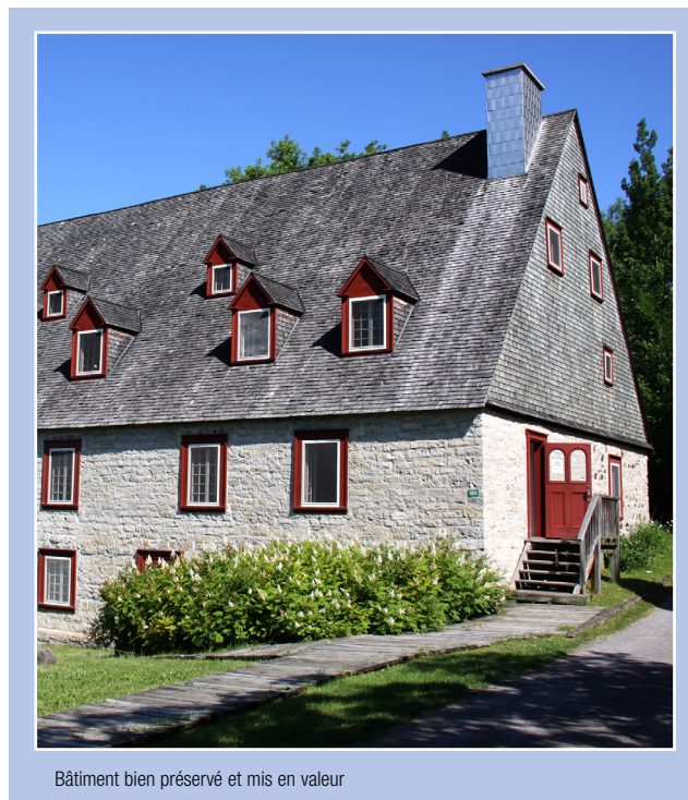
Bâtiment bien préservé et mis en valeur