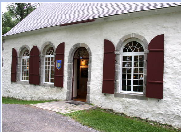
Bureau touristique aménagé dans la chapelle Cuthbert, Berthierville

On peut penser que le voyageur qui fréquente le réseau des villages-relais souhaite rendre son expérience de déplacement plus agréable. Curieux de nature, il est peut-être même prêt à faire un détour pour connaître de nouveaux coins de pays, redécouvrir un village qu'il a jadis fréquenté ou revenir vers un lieu qu'il apprécie particulièrement. Il accorde de l'importance à la qualité du paysage et de l'environnement. Il apprécie l'authenticité, le contact personnalisé et cherche à rencontrer des gens ancrés dans leur milieu. Chose certaine, ce voyageur s'intéresse au territoire et à ses habitants. Il y a fort à parier que les sites historiques, les milieux naturels et le terroir l'interpellent. En somme, le nouveau réseau de villages-relais propose un environnement de qualité aux usagers de la route.