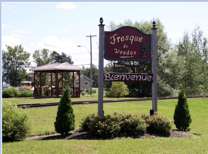
Aménagement paysager, parc central – sentier de la fresque, Weedon

En plus des panneaux le long de la route, un aménagement paysager des entrées de la localité permet d'annoncer subtilement et efficacement que le village approche. Le marquage spatial des abords de la route peut améliorer la lisibilité du paysage et du changement d'échelle qui s'opère. La transition doit s'effectuer progressivement et inciter les automobilistes à réduire leur vitesse à l'approche de la zone urbaine. Par exemple, des plantations d'arbres de plus en plus rapprochées entre elles et la route contribuent à refermer l'espace et envoient le signal que l'on arrive au cœur de la zone animée du village. Un changement dans le choix des végétaux plantés peut aussi indiquer que le noyau villageois n'est plus très loin, par exemple, passer d'arbres majestueux en milieu agricole à des arbres moins imposants et florifères en milieu urbain. Bref, la signalisation routière et l'aménagement des entrées du village vont de pair et contribuent à créer une approche conviviale qui peut inciter les passants à s'arrêter.