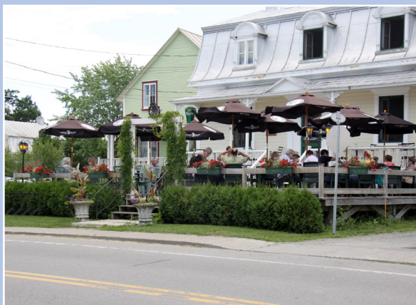
Café-terrace, rue Principale, Deschambault-Grondines