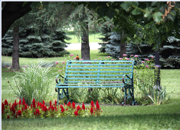
Mise en valeur d'une aire de repos, Deschambault-Grondines

La sécurité du site est un aspect important. Les environs doivent être éclairés toute la nuit et dégagés de manière à faciliter la surveillance du site. Attention à la présence de secteurs reclus où des agressions peuvent être commises. De plus, il faut considérer la hauteur et l'opacité des végétaux au pourtour du site. Les arbustes ne doivent pas constituer des cachettes pour d'éventuels agresseurs. L'aire d'information doit avoir des dimensions proportionnées pour que l'utilisateur se sente à l'aise. On doit éviter de la placer dans un vaste stationnement froid et non aménagé, ce qui peut créer une atmosphère non accueillante.