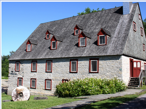
Moulin de La Chevrotière, Deschambault-Grondines