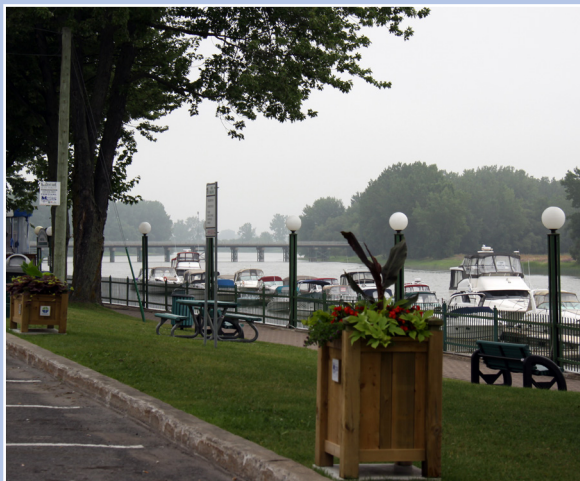
Aménagement paysager, parc de l'Héritage, Dégelis