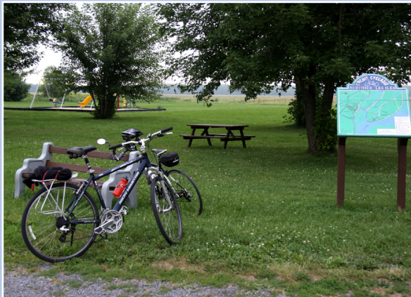
Piste cyclable, Berthierville