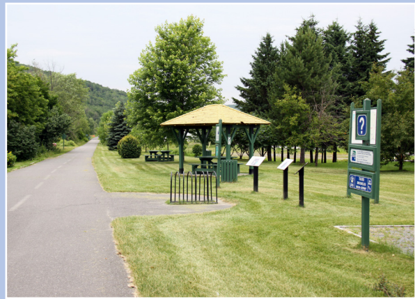
Aménagement, parc de l'Héritage, Dégelis