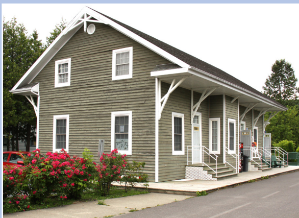
Ancienne gare de l'Heritage, Dégelis

Le processus de conception doit inclure la consultation de l'ensemble des acteurs du milieu. Une série de besoins et d'objectifs sont préalablement déterminés avant le choix final de l'emplacement de l'aire d'information et l'élaboration des esquisses. L'aire d'information représente l'espace où l'on consulte le panneau et où l'on obtient des renseignements à propos des services offerts dans le village. Elle peut être intégrée à un lieu existant déjà aménagé. La Municipalité peut décider de consulter la population pour trouver le meilleur emplacement. Ce lieu doit comprendre suffisamment d'espace pour permettre d'y installer le panneau d'information et d'aménager une placette plus ou moins grande autour de celui-ci. Le site doit favoriser l'échelle humaine. Les paragraphes suivants traitent des principaux critères à considérer.