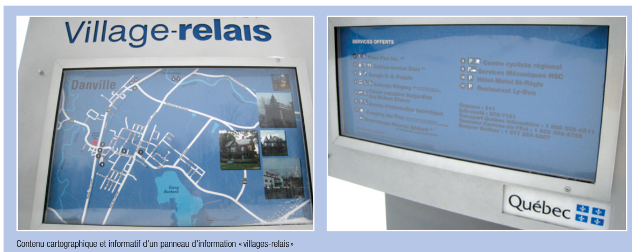
Contenu cartographique et informatif d'un panneau d'information «villages-relais»

La position du panneau doit faciliter sa consultation debout et permettre aux utilisateurs de s'en approcher et de circuler autour. Il est important de rappeler que les deux faces du panneau donnent des renseignements et qu'elles doivent être accessibles de part et d'autre. Le contenu doit être positionné de sorte qu'il soit facile de repérer l'information recherchée, par exemple, orienter la carte du village dans le même sens que les rues environnantes. Un point de repère important consiste à désigner l'aire d'information directement sur la carte du panneau en indiquant : «Vous êtes ici».