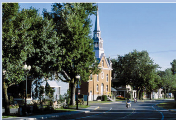
Arbres matures créant une ambiance conviviale dans le village de l'Assomption, Québec