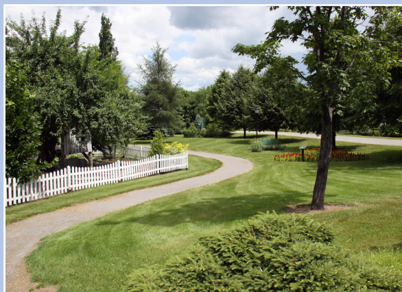
Sentier pédestre des jardins du cap Lauzon, Deschambault-Grondines