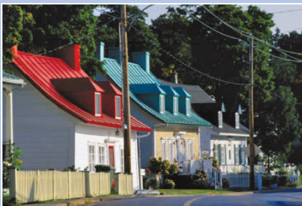
Maisons traditionnelles bien préservées à l'Île d'Orléans, Québec

De nouveaux idéaux sont en voie d'être encouragés et comblés sur les routes québécoises.