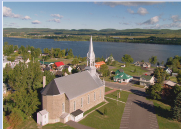
Vue des aires d'un village du Québec