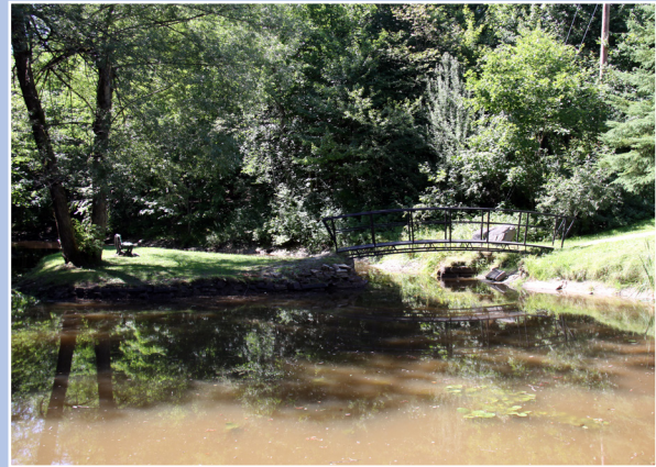
Parc du Vieux-Moulin, Weedon