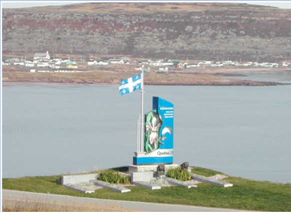
Borne d'accueil et élément signalétique Blanc-Sablon, Québec

Les pages qui suivent proposent, entre autres, le détail des objectifs à atteindre concernant l'approche client pour répondre adéquatement aux besoins des usagers de la route. Elles abordent aussi les considérations sur lesquelles on doit s'arrêter pour déterminer les lieux propices à l'aménagement des aires de service et les principes à observer pour intégrer le panneau d'information dans son milieu récepteur. Finalement, il est question des étapes à suivre pour le bon cheminement d'un projet d'aménagement.