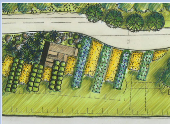
Plan d'aménagement d'un marquage paysager en bordure d'une route OPTION aménagement