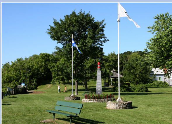
Aménagement commémoratif, Deschambault-Grondines

Un site favorable possède des caractéristiques intrinsèques et un fort potentiel attractif. Il peut s'agir d'un lieu de rassemblement spontané. Stratégiquement, l'aire d'information doit se trouver près du cœur du village, non loin des principaux attraits et lieux de convergence, par exemple à côté d'un bureau d'information touristique, en bordure d'un espace vert, d'un attrait particulier du paysage ou d'une place publique, non loin d'un bâtiment municipal reconnu ou d'un lieu symbolique tel qu'une église. La proximité de la route verte ou d'un réseau de pistes cyclables est un atout supplémentaire. Toutefois, l'intégration du panneau peut, dans certains cas, être plus difficile en raison de sa signature contemporaine et de sa structure robuste qui peuvent contraster avec un cadre plus « champêtre ».