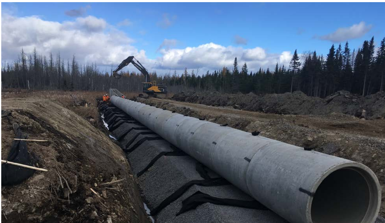
Installation d'un ponceau sur le tronçon 2.

Consultez la page Web du projet autoroutier sur le site du Ministère.