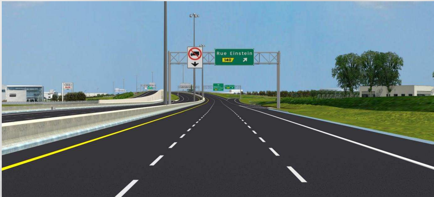
Autoroute Henri-IV, direction nord