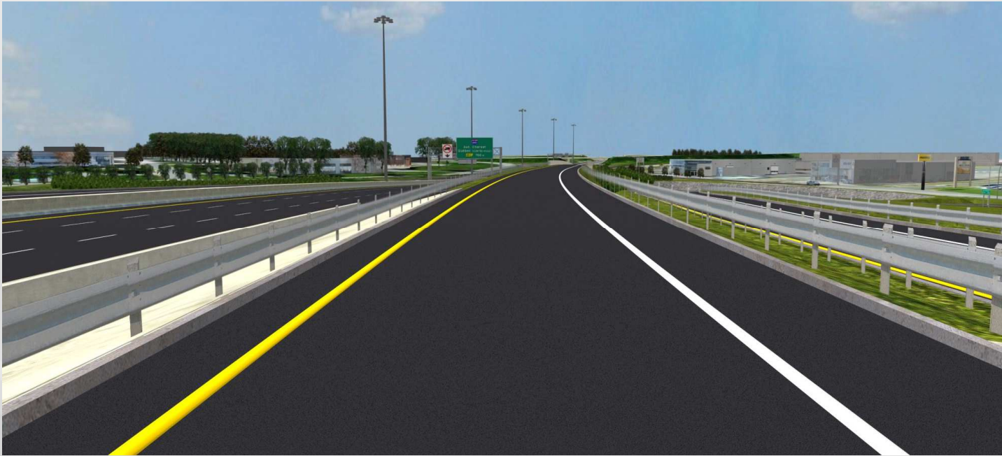
Circulation sur la bretelle étagée