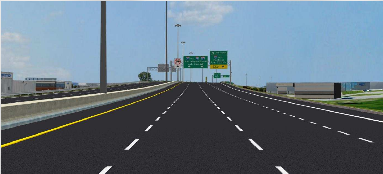
Autoroute Henri-IV, direction sud