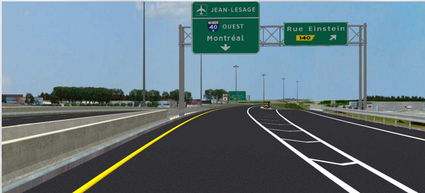
Circulation sur la bretelle étagée