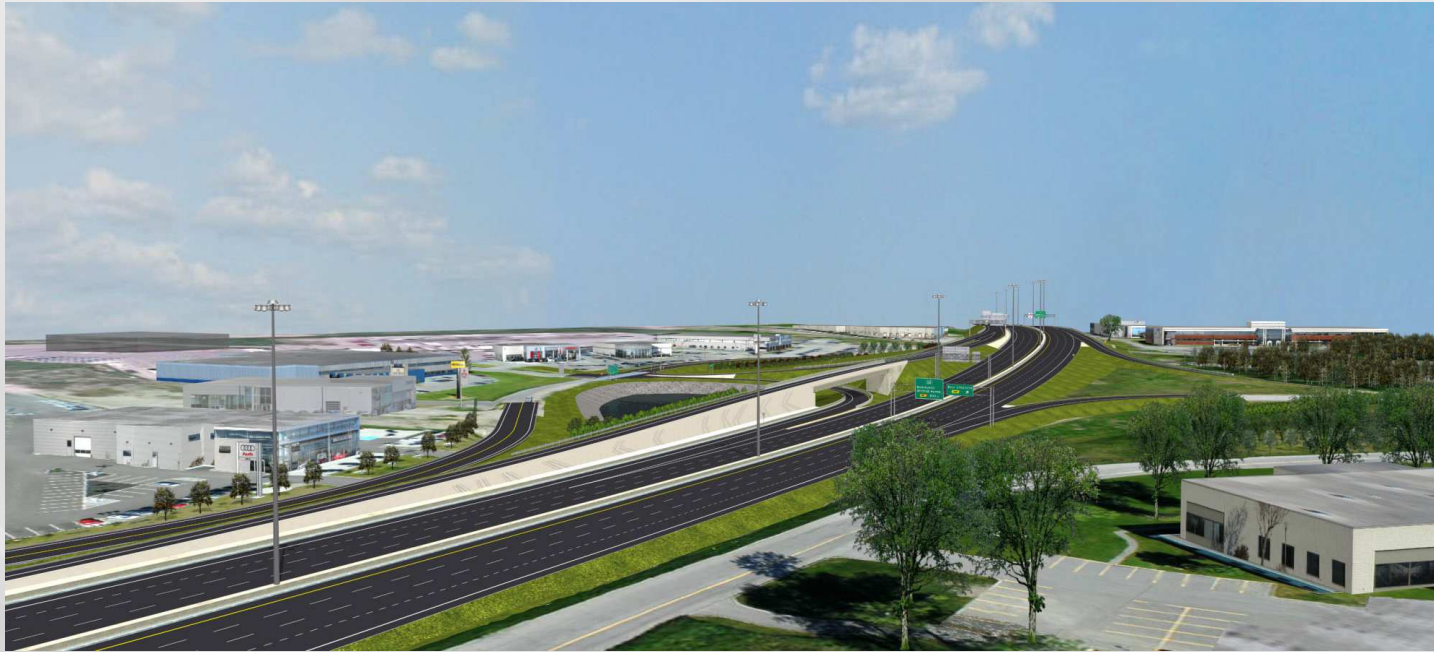
Vue aérienne de l'échangeur Henri-IV/Einstein