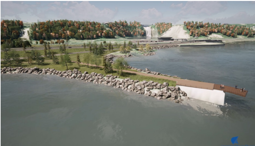
Aménagements du côté de l'île d'Orléans