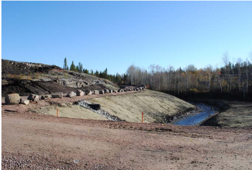
L'accès au lac Petit Bras a été relocalisé. On aperçoit ici la rivière Le Petit Bras.