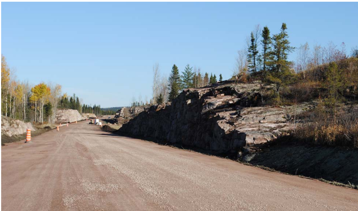
Début du prolongement de l'avenue du Labrador. Les travaux se poursuivent sur 1,1 km.

Le prolongement de l'avenue du Labrador s'inscrit dans le cadre du projet B. Le reste des travaux, comprenant le nouveau tracé sur 4 km, ainsi que la reconstruction de la route entre les km 4 et 22, devrait débuter en 2018, conditionnellement à l'obtention des diverses autorisations nécessaires.