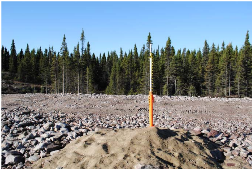
Qu'est-ce que c'est ? Il s'agit d'un piézomètre, un appareil permettant de mesurer les variations de pression et du niveau d'eau dans le sol. Les mesures obtenues permettront de connaître la fin des tassements des sols en place, ce qui assurera la stabilité des ouvrages. On en trouve à plusieurs endroits dans la zone de travaux.